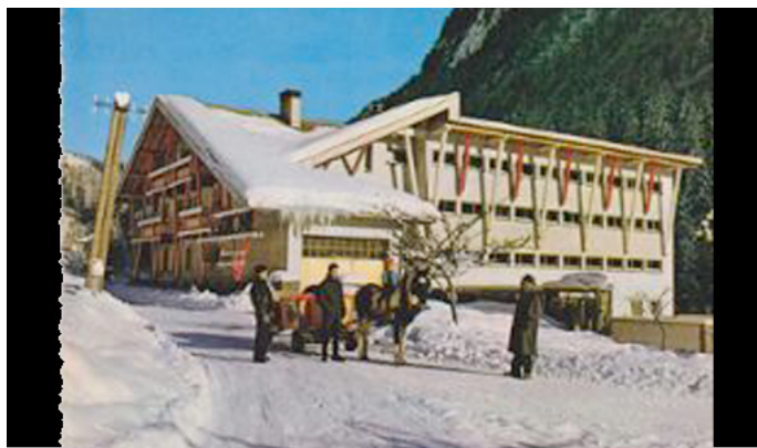
C h a l e t d u X I V °

Un lieu en bord de chemin invitant à l'échange et au partage, un lieu de rencontre où les villageois se retrouvaient après avoir travaillé dans les champs, ainsi, ce lieu s'est naturellement transformé en pension de famille, puis en taverne où les habitants se sont retrouvés pour fêter la fin de la guerre en 1918.