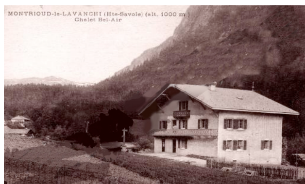
C h a l e t B e l - A i r

C'est dans cette très ancienne construction de plus d'un siècle que cet univers saisissant a été créé.